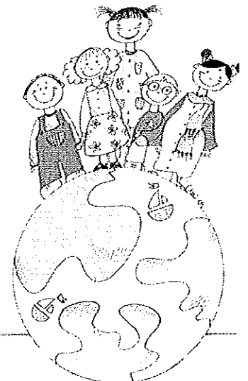
Anu Uhtio toiminnanjohtaja Adoptioperheet ry