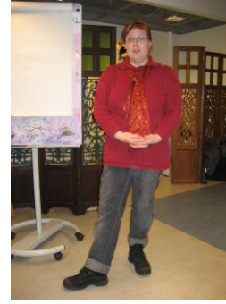
Viivi tykkää koulusta -kirjan julkistamistilaisuus