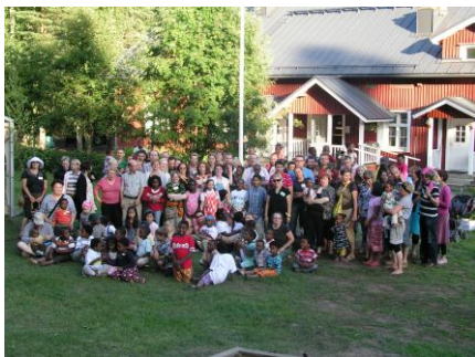
Etelä-Afrikka-perheiden tapaaminen Kannonkoskella.